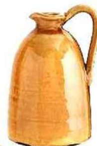
Pichet en céramique émaillée, Madam Stoltz, 50 €.