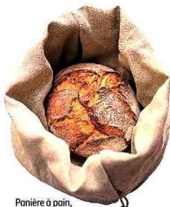
Panière à pain, en lin, garnie de noyaux de cerises, C.Quoi?, 54 €.