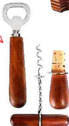
Lot de tire- bouchon, ouvre-bouteille et bouchon grand office, en manguier et Inox, Comptoir de Famille, 29,90 €.