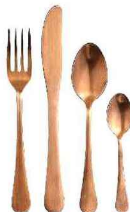
Couverts en acier émaillé, Acier & Titane, Love Creative People, 49 € le lot de 4.