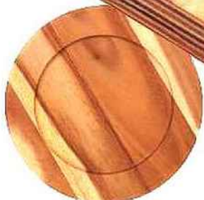
Assiette en acacia, Abi, Habitat, à partir de 12,90 €.