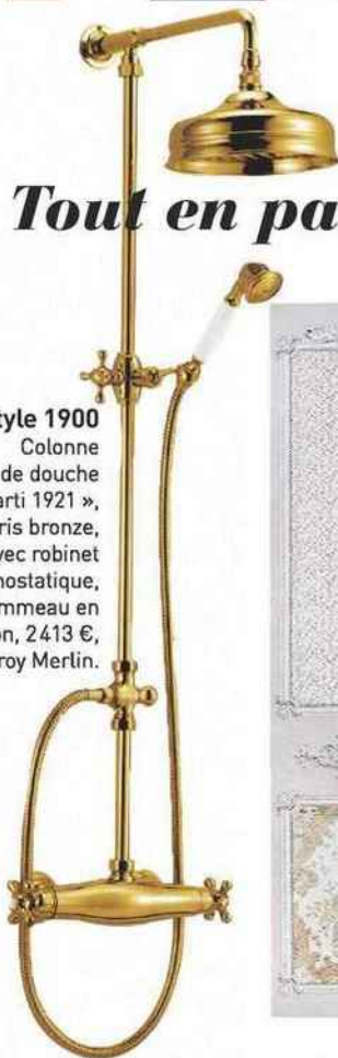
Style 1900 Colonne de douche « Marti 1921 », coloris bronze, avec robinet thermostatique, pommeau en laiton, 2413 €, Leroy Merlin.