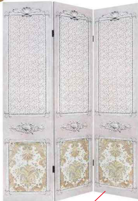
Théâtral Paravent « Fêtes Exquises », en toile et bois, H 180 x L 120 cm, 150 €, Mathilde M.