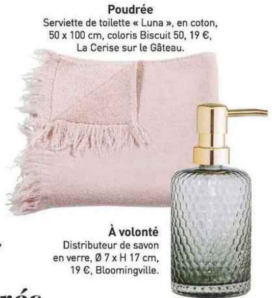
Poudrée Serviette de toilette « Luna », en coton, 50 x 100 cm, coloris Biscuit 50, 19 €, La Cerise sur le Gâteau.