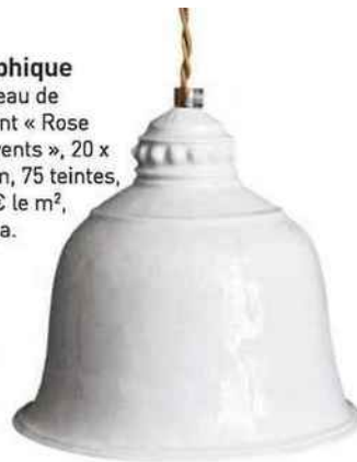
Antique Suspension « Angkor », en porcelaine de Limoges émaillée, Ø 15,5 x H 18 cm, à partir de 180 € (abat-jour seul), Alix D. Reynys.