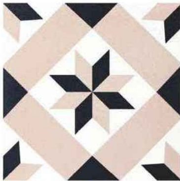
Graphique Carreau de ciment « Rose des vents », 20 x 20 cm, 75 teintes, 114 € le m 2 , Bahya.