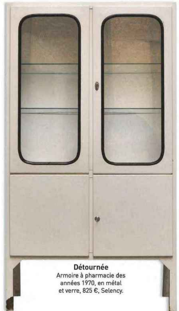
Détournée Armoire à pharmacie des années 1970, en métal et verre, 825 €, Selency.