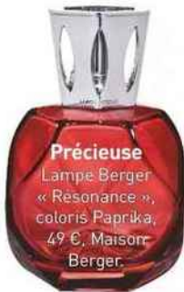
Précieuse Lampe Berger « Résonance », coloris Paprika, 49 €, Maison Berger.

Circulaire Suspension « Loop », structure en acier, abat-jour en tissu, H 82 x L 82 x P 55 cm, 786 €, BS.Living.