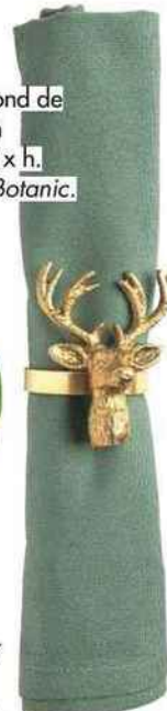
Majestueux. Rond de serviette cerf en aluminium, ø 5 x h. 8 cm, 3,35 €, Botanic.