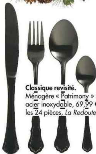
Classique revisité. Ménagère « Patrimony » en acier inoxydable, 69,99 € les 24 pièces, La Redoute.