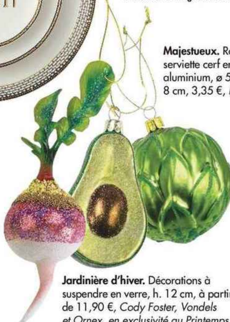
Jardinière d'hiver. Décorations à suspendre en verre, h. 12 cm, à partir de 11,90 €, Cody Foster, Vondels et Ornex, en exclusivité au Printemps.