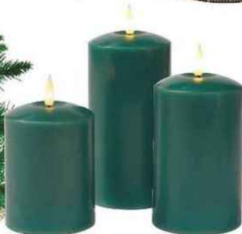
Réalistes. Bougies « Piliers TruGlow » en cire et Leds, h. 10, 12,5 et 15 cm, 34,49 € les 3, Lights4fun.