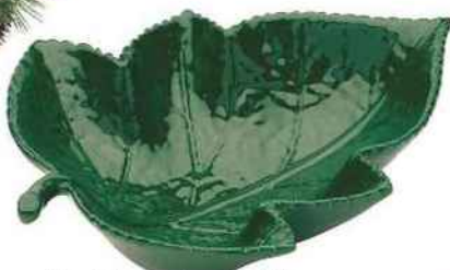
Esprit barbotine. Plat de présentation feuille en dolomite, L. 31 cm, 2,90 €, E.Leclerc Maison.