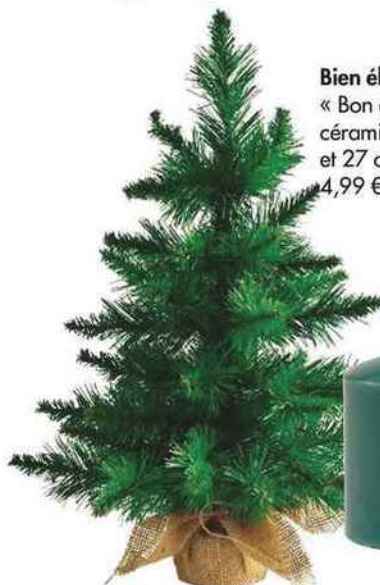
Éternel. Sapin « X-Mas » en PVC, h. 45 cm, 4,95 €, Casa.

Glaner de légers branchages et quelques glands en forêt ou au jardin. Percer un trou traversant dans chaque gland et les réunir avec un fil de fer fin. Passer ce fil de fer autour d'une serviette et l'agrémenter de branchages pour un résultat plein de charme. À associer avec des couverts anciens et du linge de table en lin.