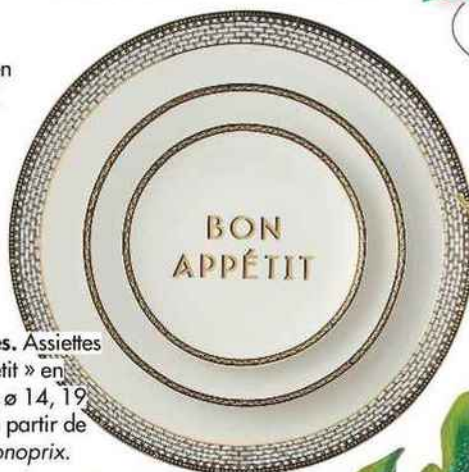
Bien élevées. Assiettes « Bon appétit » en céramique, ø 14, 19 et 27 cm, à partir de 4,99 €, Monoprix.