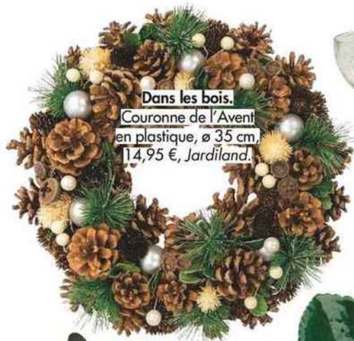
Dans les bois. Couronne de l'Avent en plastique, ø 35 cm, 14,95 €, Jardiland.