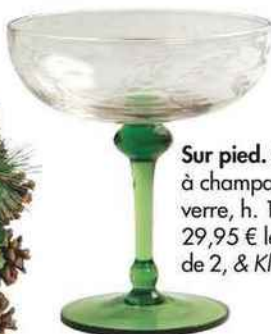
Sur pied. Coupe à champagne en verre, h. 12 cm, 29,95 € le set de 2, & Klevering.