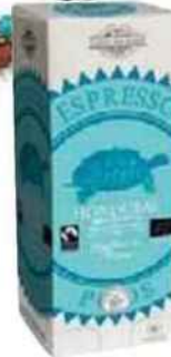
Café Honduras bio et équitable (Comptoirs Richard, 10,60 €).