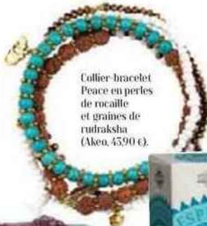
Collier-bracelet Peace en perles de rocaïlle et graines de rudraksha (Aken, 45,90 €).