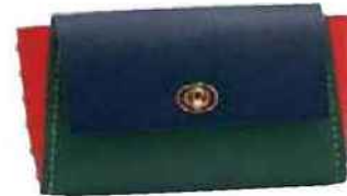
Box sac banane Do It Yourself (Le Pigeon Coq, 129 €).