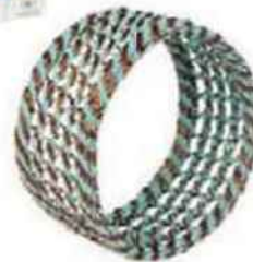
Bracelet en fils de téléphone tressés (Mahatsara, 55 €).