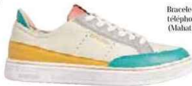
Sneakers vegan (Superdry, 99 €).