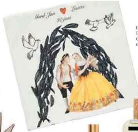
Carreau en céramique Love is in the air (Story Tiles, à partir de 40 €).