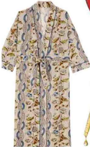
Kimono à fleurs en viscose EcoVero (Monoprix, 49 €).