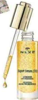
Sérum concentré anti-âge (Nuxe, 70 €).