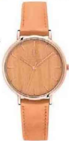
Montre femme avec cadran en bois de peuplier (Pierre Lannier, 119 €).