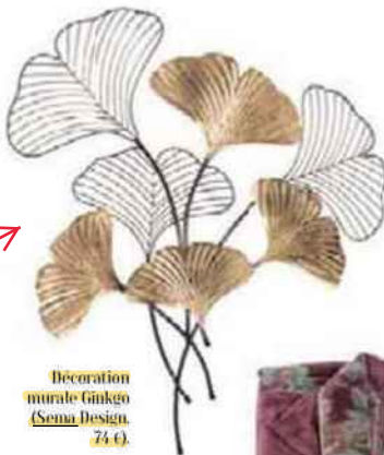
Décoration murale Ginkgo (Sema Design, 74 €).