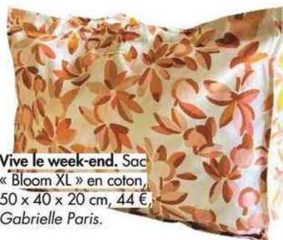
Vive le week-end. Sac « Bloom XL » en coton, 50 x 40 x 20 cm, 44 €, Gabrielle Paris.