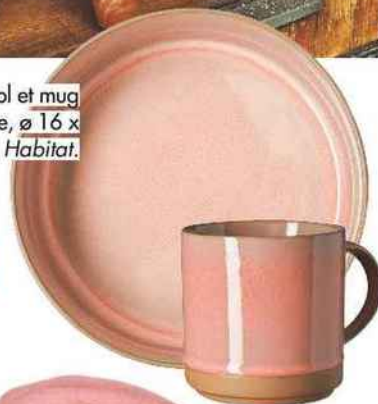
Petit déj en amoureux. Bol et mug « Rosie » en porcelaine, ø 16 x 9,2 cm, 6,90 € et 5,90 €, Habitat.