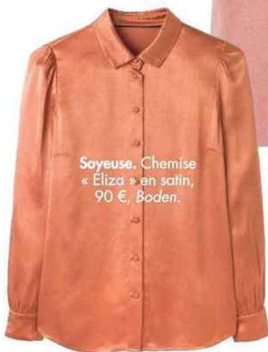
Soyeuse. Chemise « Eliza » en satin, 90 €, Boden.