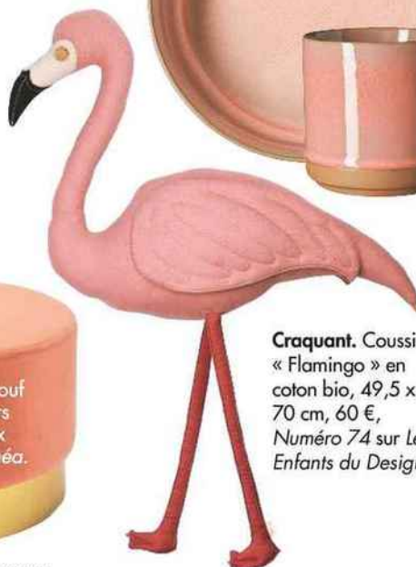
Craquant. Coussin « Flamingo » en coton bio, 49,5 x 70 cm, 60 €, Numéro 74 sur Les Enfants du Design.