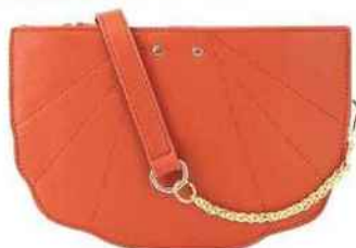
Adorable. Sac en synthétique, 40 €, Moony Mood chez Spartoo.