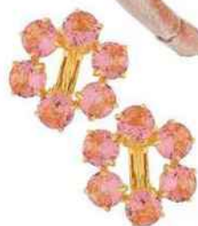
Précieuses. Boucles d'oreilles en laiton doré à l'or fin et pierres de verre taillé, 80 €, Les Néréides.