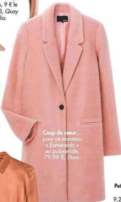
Coup de cœur... pour ce manteau « Esmeralda » en polyamide, 79,99 €, Etam.