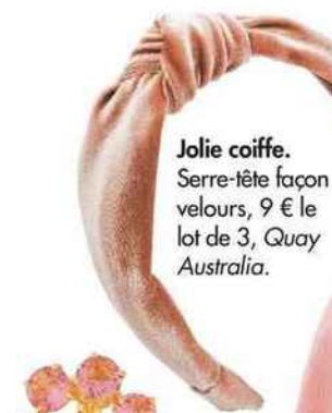
Jolie coiffe. Serre-tête façon velours, 9 € le lot de 3, Quay Australia.