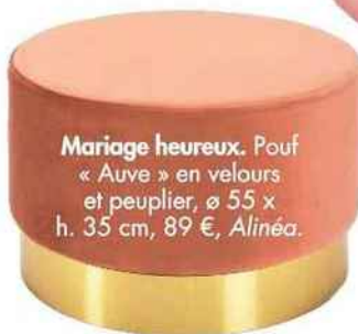
Mariage heureux. Pouf « Auve » en velours et peuplier, ø 55 x h. 35 cm, 89 €, Alinéa.